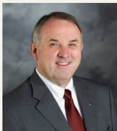
Рон Д. БЪРТЪН, ПРЕДСЕДАТЕЛ НА СЪВЕТА НА ПОПЕЧИТЕЛИТЕ НА ФОНДАЦИЯ РОТАРИ