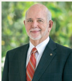
БАРИ РАСИН ПРЕЗИДЕНТ, РОТАРИ ИНТЕРНЕСЪНЪЛ